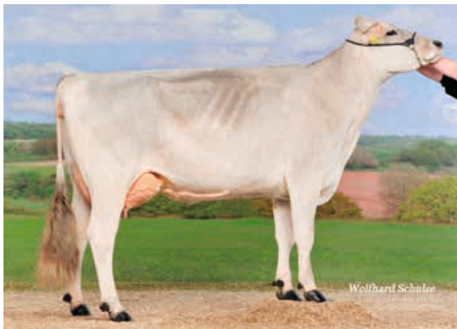
Emotion VG 86 - Urgroßmutter des Verlosungskalbs

Wir heißen sie willkommen bei der German Dairy Show am 09. Und 10. Juni 2023 in Alsfeld, also nutzen Sie die Gelegenheit und überzeugen Sie sich selbst von LT Erna am Stand der Qnetics Jungzüchter und unterstützen sie unsere Jungzüchterarbeit mit dem Kauf Ihrer persönlichen Glückslose.