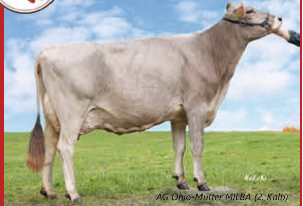
AG Ohio-Mutter MILBA (2. Kalb)