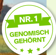
HEISS GZW 150