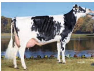
Aus der Kuhfamilie Matrosin VG 87