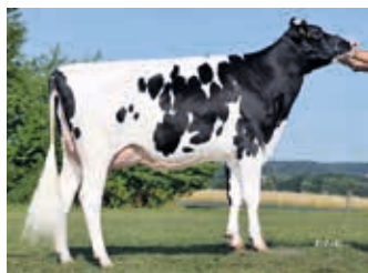
Mutter GRI Nora GP 84