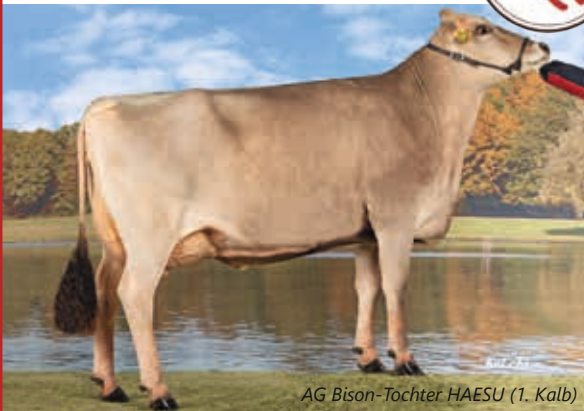
AG Bison-Tochter HAESU (1. Kalb)